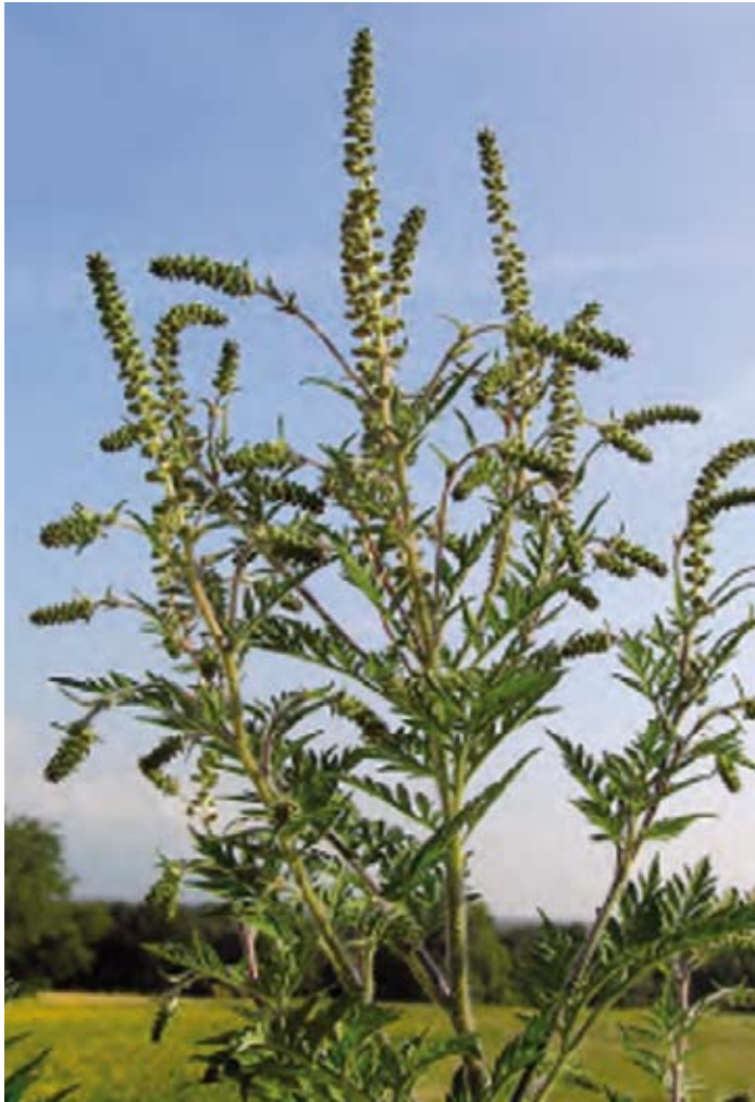
Ambrosia artemisiifolia – Beifußblättriges Traubenkraut

Beim ersten Frost stirbt die einjährige krautige Pflanze ab, hat aber dann bereits für hunderte oder tausende Samen gesorgt, ein großes Exemplar kann pro Saison bis zu 60.000 Samen hervorbringen.