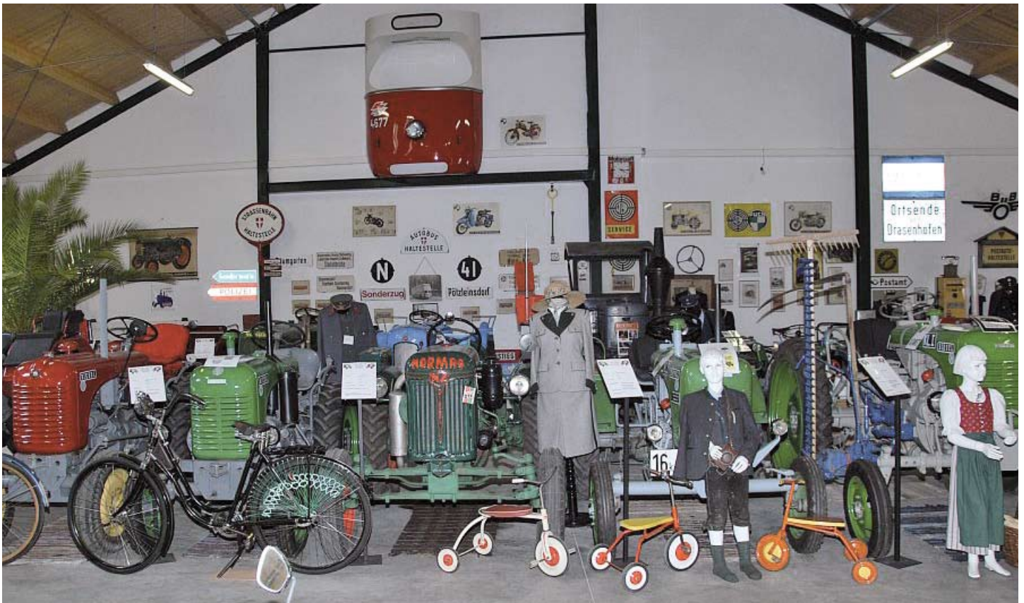
Blick in das Traktorium von Daniela und Hannes Morocutti.

Außerdem werden auf Anfrage Traktorrundfahrten angeboten, die von wenigen Stunden bis zu einem Tag dauern können.